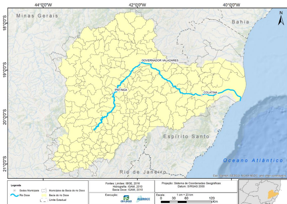
Figura 1: Bacia Hidrográfica do Rio Doce

Pode ser considerada ainda privilegiada no que se refere à grande disponibilidade de recursos hídricos, mas há desigualdade entre as diferentes regiões da bacia. A Figura 1, a seguir, apresenta a Bacia Hidrográfica do Rio Doce.